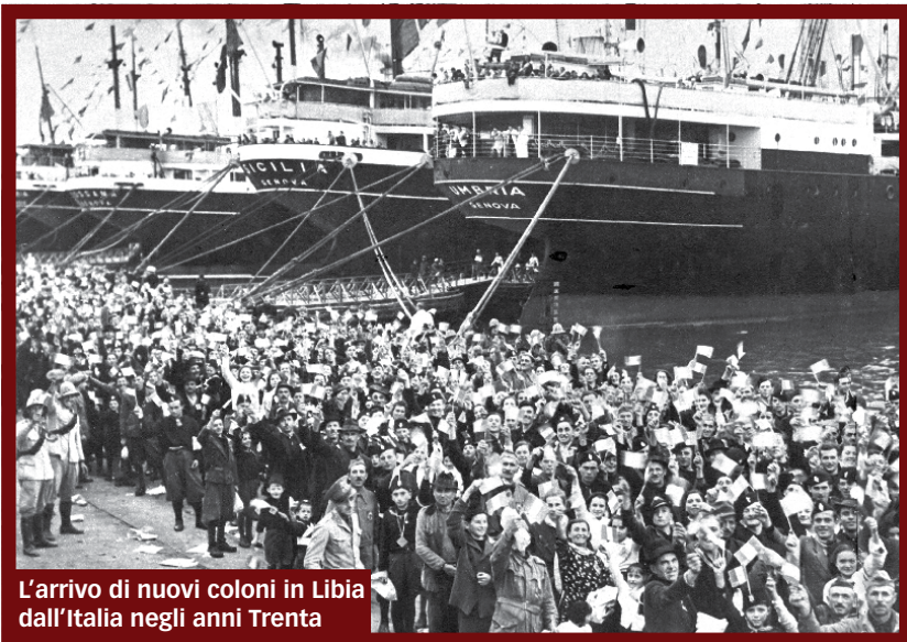
L'arrivo di nuovi coloni in Libia dall'Italia negli anni Trenta

Sergio Romano, «Corriere della Sera», 20 novembre 2007